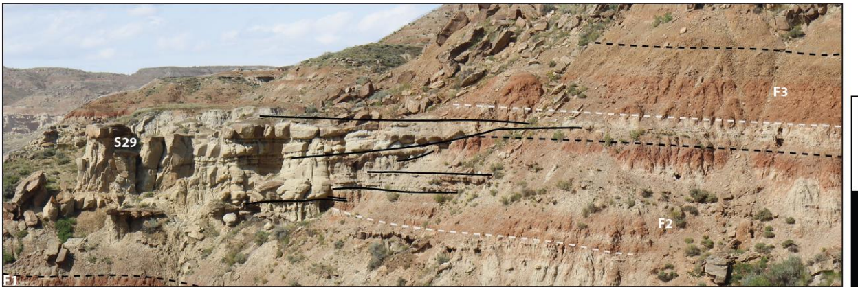
Figuur 1. Een bestudeerde ontsluiting waarin stroomgordel-zanden (links) geconnecteerd konden worden aan meer rode komgrond-afzettingen (rechts). Dit zijn vroeg Eocene afzettingen uit het Bighorn Basin, Wyoming, Verenigde staten. De schaal is 10 m.

binnen het afzettingsmilieu, zogenaamde autogene variatie. Lange-termijn variaties in zandvoorkomens konden daarnaast worden gerelateerd een lange-termijn klimaatsinvloed. De stroomgordel zanden zijn beschreven, gekwantificeerd en gerelateerd aan variatie in de komgronden waaruit een voorspellende waarde volgt die gebruikt kon worden in de ondergrondmodellen van de casus studies. Hiermee is niet alleen veel kennis vergaard over rivierafzettingen en de bijbehorende klimatologische variabiliteit, maar is deze kennis direct breed toepasbaar gemaakt (zie Abels et al. 2020). Voorwaarts stratigrafische numerieke model analyses laten zien hoe cyclische variatie invloed heeft op rivierafzettingen en hoe dit signaal verzwakt benedenstrooms door lokale variatie (Wang et al. 2021). De Carboon en Trias ondergrond studies laten zien dat cyclostratigrafische analyse van deze series significant verbeterde correlatie raamwerken kan opleveren. Daarnaast laat de analyse zien dat er soortgelijke, lange-termijn variatie voorkomt in deze sequenties, wat een sterk voorspellende waarde oplevert voor zandvoorkomens in onze ondergrond. Tot slot is met deze twee studies de toepassingsmethodiek verder ontwikkeld en in meer algemene zin uitgeschreven, zodat deze algemeen inzetbaar is voor elke duurzame toepassing in de ondergrond (zie Abels et al. 2020).