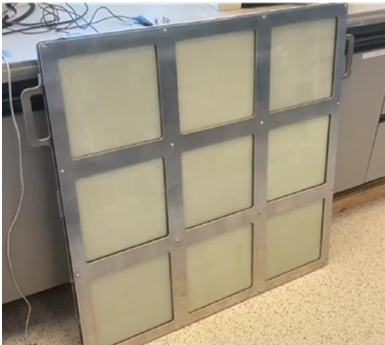
Figuur 2: 1 m 2 demonstratie panel van het EZRA project op basis van EC technologie.

Wat verdere kostenbesparing betreft is in dit project ook gekeken naar het gebruik van folies, wat zeer veel belovend was voor de EF route. Echter bleek de EF route zelf ongeschikt in dit project, waardoor de folies alsnog toegepast werden voor de EC route. Hoewel dit tijdelijk werkte met een hoge schakel efficiëntie bleek de stabiliteit wegens het ontbreken van 500 °C calcinatie stap zeer beperkt. Dergelijke temperaturen zijn niet mogelijk in combinatie met folies. Door het toepassen van innovatieve processing technologie, namelijk photonic flash sintering (PFS), is in dit project een poging gedaan dit probleem te ondervangen. Hierbij worden de coatings zeer lokaal verwarmd middels licht in plaats van een traditionele warmte (waarbij het geheel een hoge temperatuur bereikt), echter bleken de folies hier niet tegen bestandig. Om deze reden is deze folie technologie niet gebruikt in de uiteindelijke EZRA demonstrator.