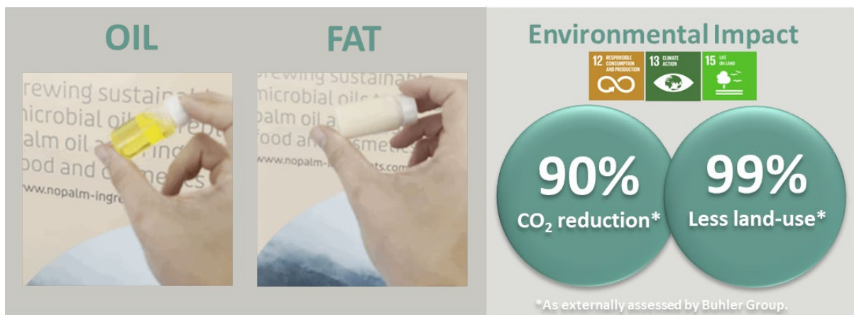
Figuur 1. Links: Twee producten verkregen met ons fermentatietechnologieplatform. Rechts: Milieu-impact voor de productie van onze gefermenteerde olie in vergelijking met die van palmolie.