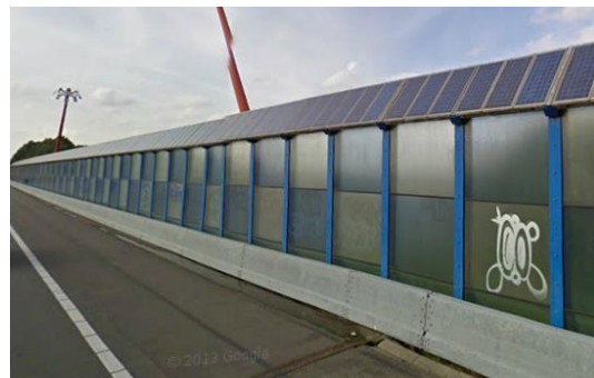
Zonnepanelen langs de A9 bij Ouderkerk aan de Amstel

fotovoltaïsche geluidsschermen langs Nederlandse snelwegen.